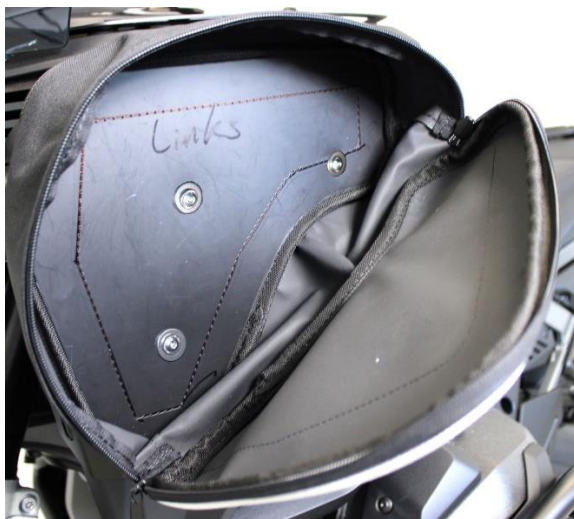
Foto vom Inneren der Tankseitentasche. Die je 3 großen Unterlegscheiben innen verwenden. Ist alles fest verschraubt, kann die Tasche schon benutzt werden.

Photo from the inside of the tank side bag. Use the 3 large washers inside. Once everything is firmly screwed together, the bag can be used.